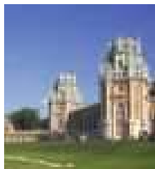
Pogled na dvorac u Zarizno parku (Moskva - Rusija)

Nagrada Bernhard Remmers za istaknuta postignuća u obrtničkoj zaštiti spomenika kulture dodjeljuje se povodom sajma "spomenici 2008" u Leipzigu već 5. put. Zato Vas srdačno pozivamo.